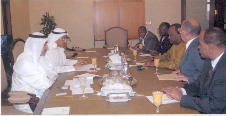
البدر استقبل رئيس برلمان بوركينا فاسو

الخليج ببرلمان ساحل العاج حيث دارت المباحثات حول المشروعات ذات الأولوية في ساحل العاج. ■