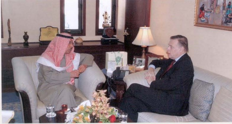
الوقيان يستقبل بوجه

شملت مشروعين في إقليم الشرق الأدنى وشمال أفريقيا ومشروع في إقليم شرق وجنوب أفريقيا.