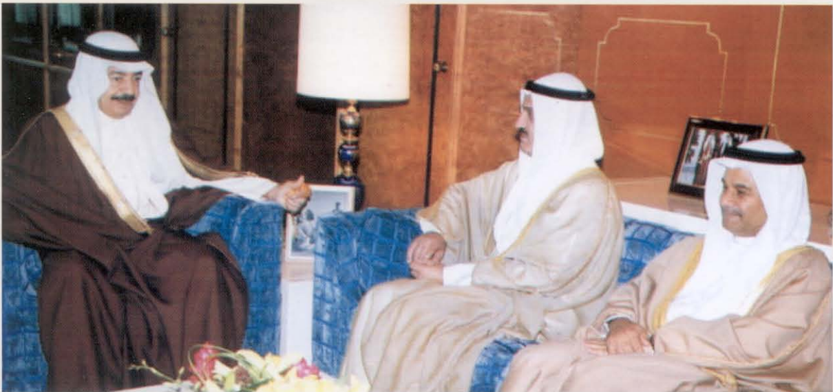
رئيس وزراء البحرين مستقبلاً الحميضي

اجتماعات الصناديق العربية التي عقدت في الرياض مؤخراً.. لبحث المشروعات التي سيتم تمويلها لإعادة إعمار مدينة بام الإيرانية التي دمرها الزلزال نهاية عام