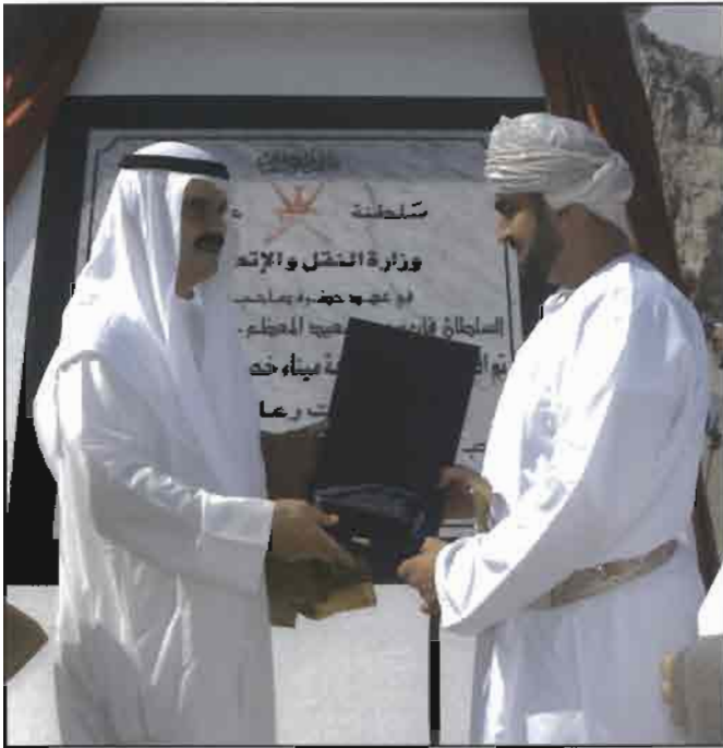
العمر يقدم درعا تذكارية