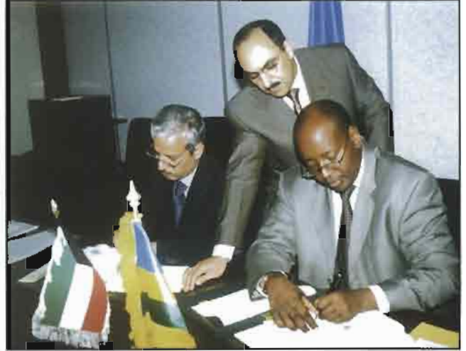
الوقيان أثناء التوقيع على الاتفاقية

اعمال تحسين حوالي 76 كيلو متراً من الطرق الترابية المرتبطة بالطريق الرئيسي اضافة الى الدعم المؤسسي لادارة الطرق والخدمات الهندسية للاشراف على تنفيذ الأعمال . وأفاد الصندوق بأنه بتوقيع اتفاقية هذا القرض فإنه يكون القرض السادس الذي يقدمه الصندوق الى رواندا حيث سبق له أن قدم لها خمسة قروض اجمالي قيمتها بـ 10.4 ملايين دينار (ما يعادل نحو 35 مليون دولار) لتمويل مشروعات في مختلف القطاعات . وقدم الصندوق أيضاً لرواندا معونة فنية بقيمة اجمالية تبلغ 93 ألف دينار (ما يعادل نحو 310 آلاف دولار) .