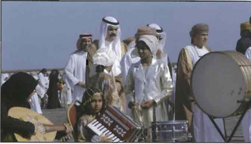
جانب من الاحتفالات العمانية