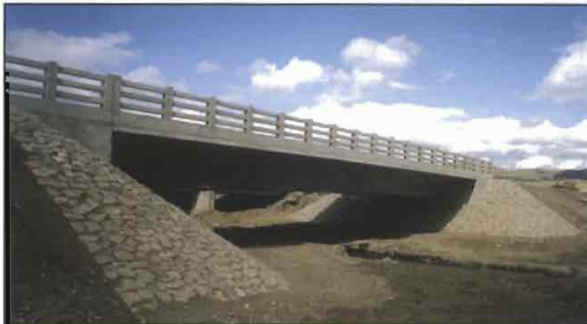
مشروع طريق وجسر درخان أردنييت الذي ساهم الصندوق في تشييده بمنغوليا

تم في اولان باتار التوقيع على اتفاقية بشأن استغلال منحة دولة الكويت بين منغوليا والصندوق الكويتي للتنمية الاقتصادية العربية ، يتولى بمقتضاها الصندوق مسؤولية ادارة المنحة البالغ مقدارها 12 مليون دولار أمريكي ، وذلك للاسهام في تمويل بناء مبنى جديد للبرلمان في منغوليا .