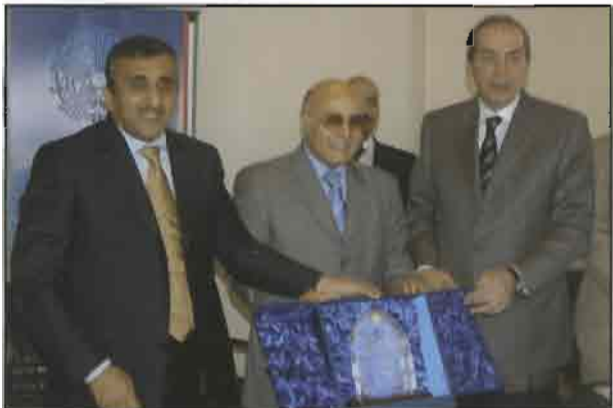
البدر يقدم للجسر هدية تذكارية من الصندوق

والمختبرات والمكتبات وغرف المعلمين والمكاتب الإدارية والخدمات الاستشارية للتصميم والإشراف على التنفيذ .