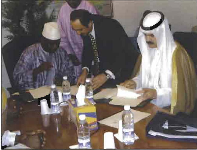
العمر أثناء التوقيع على الاتفاقية

12 قرصاً تبلغ قيمتها الاجمالية 53.9 مليون دينار كويتي (اي ما يعادل حوالي 183.3 مليون دولار أمريكي) لتمويل مشروعات في قطاعات النقل والاتصالات والطاقة والتعليم والاصلاح الاقتصادي . اضافة الى ثلاث منح بقيمة اجمالية قدرها 417 ألف دينار كويتي (اي ما يعادل حوالي 1.42 مليون دولار أمريكي) لتمويل دراسات فنية واقتصادية.