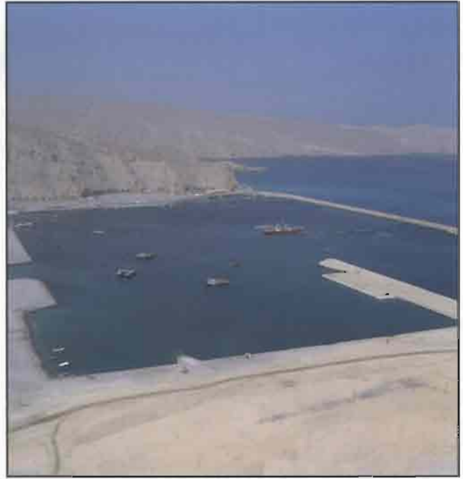
جانب من ميناء خصب الذي ساهم الصندوق الكويتي في تمويله

فنحن أشقاء أبناء دين واحد ووطن واحد تجمعنا مصالح واحدة ويربطنا مستقبل ومصير واحد.