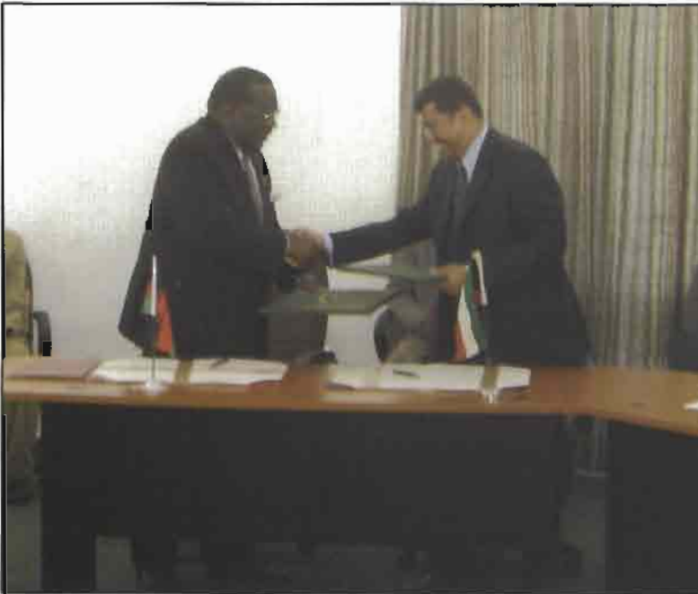
ويتبادل وثائقها مع غونديري

تم في ليلنغوي التوقيع على اتفاقية قرض بين ملاوي والصندوق الكويتي للتنمية الاقتصادية العربية بقيمة أربعة ملايين دينار (ما يعادل 13.6 مليون دولار) للاسهام في تمويل مشروع طريق ثيولو - بانغولا .