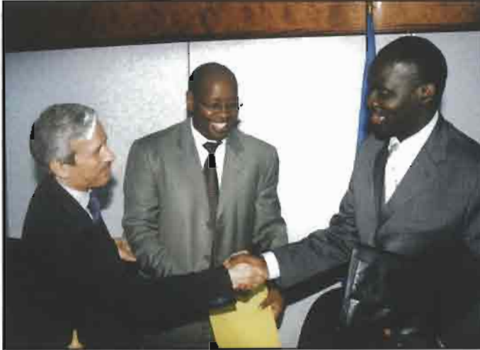
ويتبادل وثائقها مع موسوني