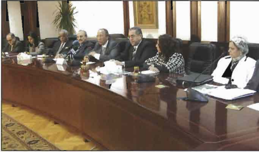
الجانب المصري خلال المباحثات

منها في كل من قطاعات الجدد وامهات التسمين وامهات البياض والبياض ودجاج التسمين . ومن المتوقع ان ينخفض حجم الانتاج مستقبلا خاصة بالنسبة لدجاج التسمين نتيجة لمحدودية طاقة المجازر الحالية والتي تقدر بحوالي 150-180 مليون دجاجة / عام وعدم توفر الطاقة المطلوبة لذبح الانتاج الكلي الذي يبلغ 750 - 800 مليون دجاجة / عام في الظروف العادية وهي الطاقة التي يجب استكمالها في المستقبل القريب حتى يتسنى تنفيذ القرارات المتعلقة بعدم نقل الدجاج الحي بين المحافظات دون مخالفات .