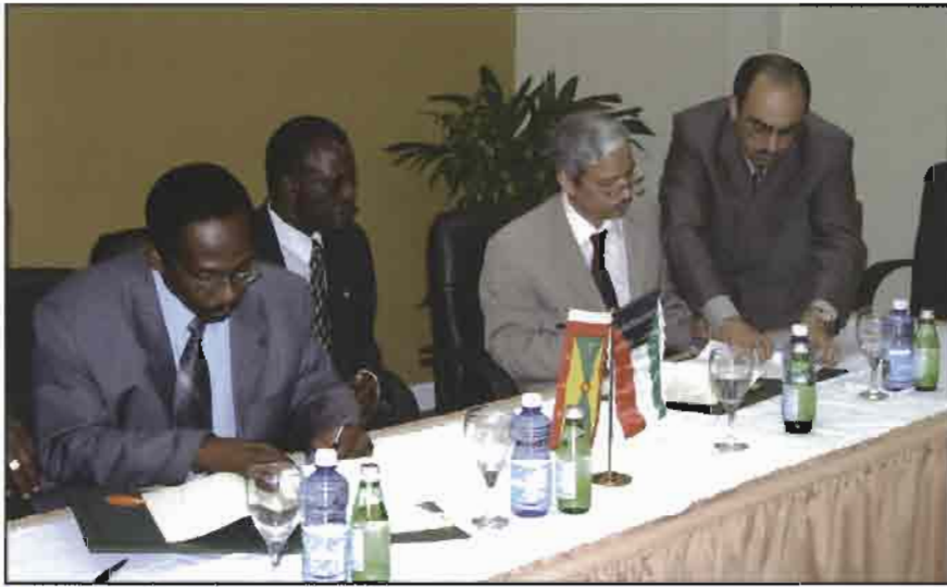
الوقيان أشاء التوقيع على الاتفاقية

مقدارهما حوالي 298 ألف دينار كويتي (أي ما يعادل حوالي 2.7 مليون دولار شرق كاريبي) لتمويل دراسات الجدوى الخاصة بمشروع في قطاع الطرق وآخر في البنية الأساسية.