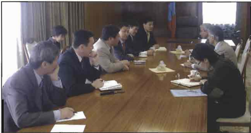
الوقيان خلال لقاءاته بعدد من الاعلاميين في منغوليا