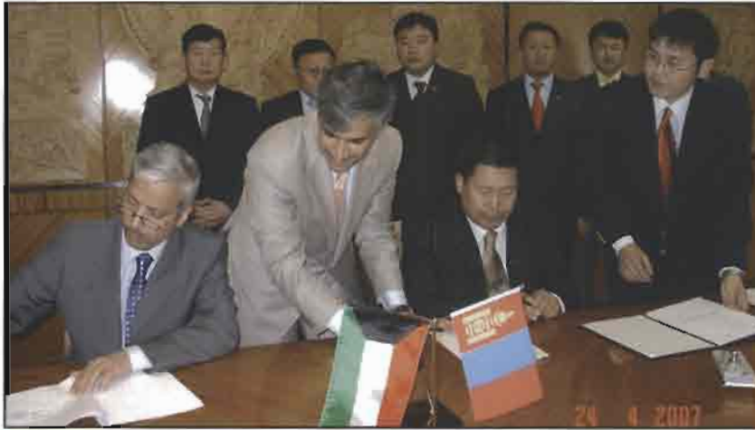
الوقيان أثناء التوقيع على الاتفاقية