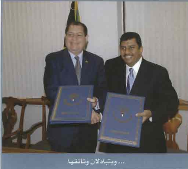
... ويتبادلان وثائقها