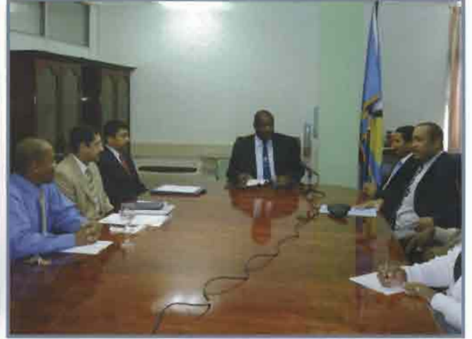
جانب من المحادثات أثناء التوقيع