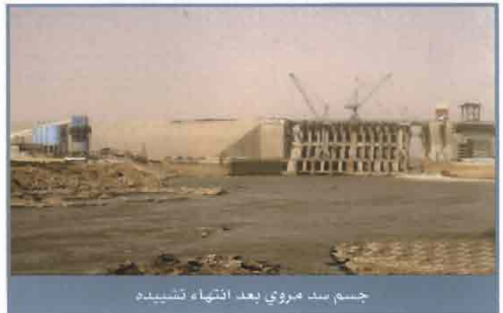
جسم سد مروى بعد انتهاء تشييده