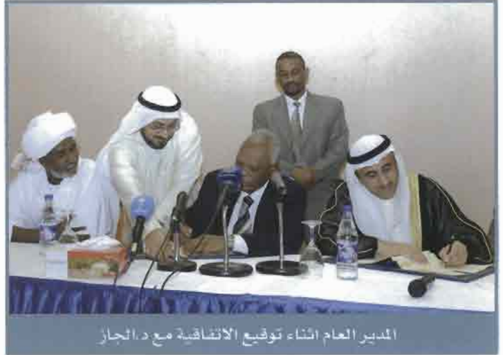
المدير العام اثناء توقيع الاتفاقية مع د.الجاز

وبتوقيع اتفاقية هذا القرض الاضائي ونفاذه، فإن الصندوق يكون قد قدم 19 قرضاً إلى جمهورية السودان لتمويل مشاريع في مختلف القطاعات تبلغ قيمتها الاجمالية حوالي 122 مليون دينار كويتي أي مايعادل 448 مليون دولار أمريكي. بالاضافة إلى ذلك قدم الصندوق ثلاث منح إلى جمهورية السودان قيمتها الاجمالية 387 ألف دينار كويتي لاعداد دراسات الجدوى لمشاريع في قطاعي الصناعة والنقل.