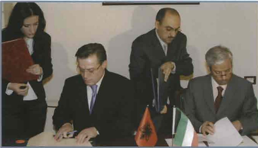
الوقيان و بودا يوقعان على الاتفاقية

وقع الصندوق الكويتي للتنمية الاقتصادية العربية وجمهورية ألبانيا على اتفاقية قرض يقدم الصندوق بمقتضاها قرصاً مقداره 6 ملايين دينار كويتي (تعاادل حوالي 21 مليون دولار أمريكي) للإسهام في تمويل مشروع "تحويلة دورس" وتقاطع فورا على طريق دورس - فورا" في جمهورية ألبانيا.