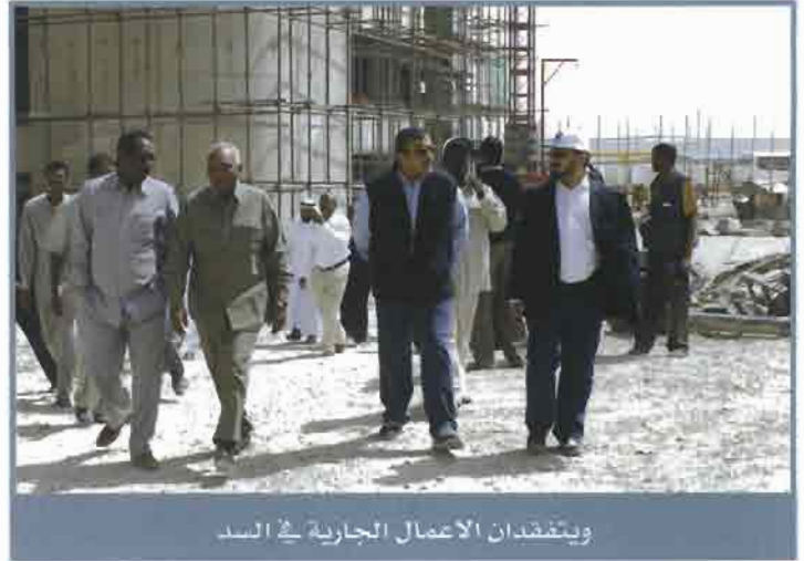
ويتفقدان الاعمال الجارية في السد