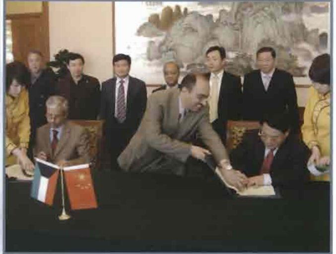
الوقيان ولي يونج اثناء توقيع الاتفاقية

شوزهو والضواحي المجاورة لها . يتكون المشروع من ثلاثة مشروعات فرعية وهي مشروع فرعي لمواجهة الفيضانات في مدينة شوزهو والتي تشمل إنشاء حواجز حماية على طرقي نهر كنفلو لمنع مياه الفيضانات المتكررة عن المدينة ويتخلل هذه الحواجز بوابات على طرفيه .