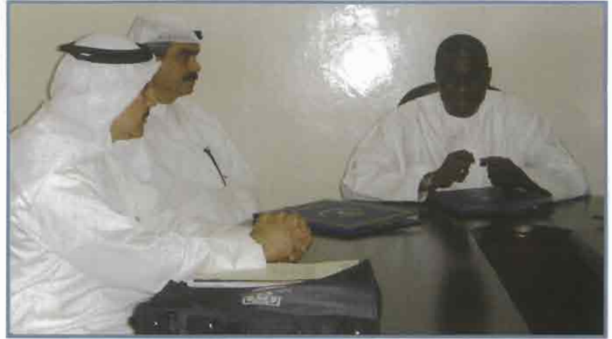
جانب من المحادثات أثناء التوقيع

أمريكي) وذلك لتمويل مشاريع في مختلف القطاعات، بالإضافة إلى خمس معونات فنية بلغت قيمتها الاجمالية 770.000 دينار كويتي (أي ما يعادل حوالي 2.7 مليون دولار أمريكي).