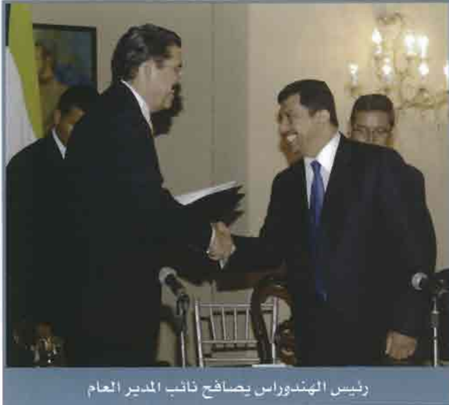
رئيس الهندوراس يصادف نائب المدير العام