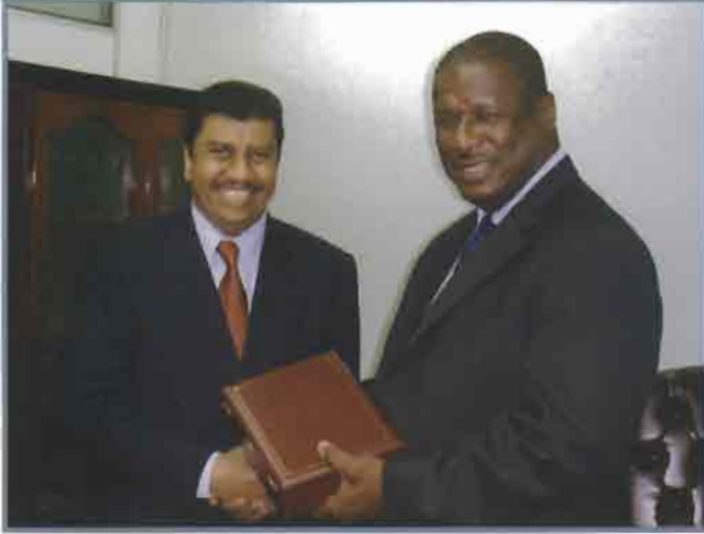
الغنيمان و كينغ يتبادلان وثائق الاتفاقية