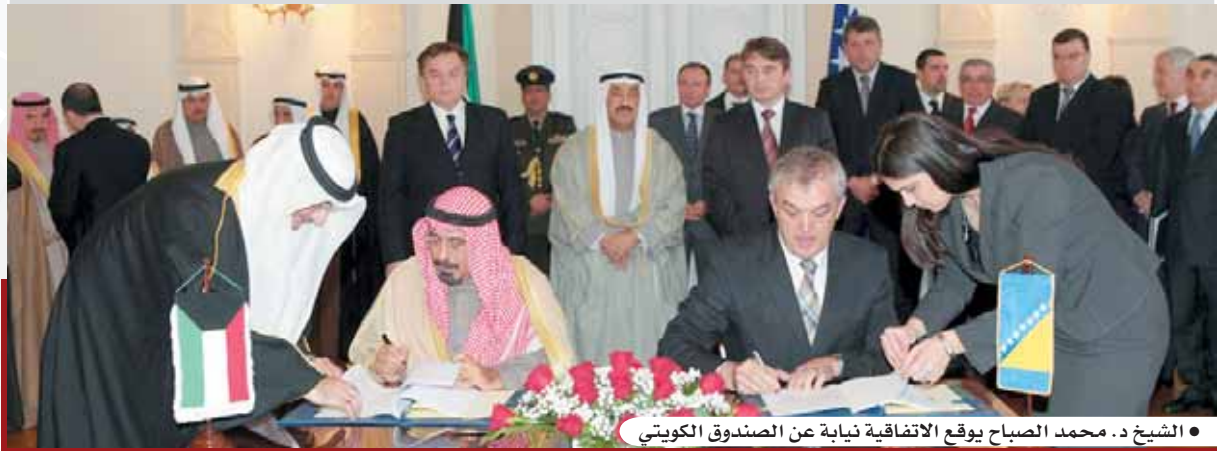
• الشيخ د. محمد الصباح يوقع الاتفاقية نيابة عن الصندوق الكويتي

النقل البري للأفراد والسلع، مما يساهم في تحسين الظروف الاقتصادية والاجتماعية للسكان في منطقة المشروع. وسوف يترتب على تنفيذ المشروع دعم مختلف جوانب التنمية في البوسنة والهرسك، من خلال زيادة حركة التجارة الإقليمية خاصة مع دول شمال شرق أوروبا.