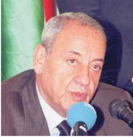
• نبيه بري رئيس مجلس النواب اللبناني