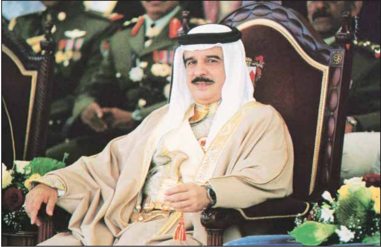
• جلالة الملك حمد بن عيسى عاهل البحرين

افتتح جلالة الملك حمد بن عيسى آل خليفة، عاهل مملكة البحرين الشقيقة ميناء خليفة بن سلمان، حيث تفقد جلالته وكبار الزوار والمدعوين وفي مقدمتهم المدير العام عبدالوهاب البدر مرافق الميناء الذي يعد أحد الرموز الجديدة لنهضة مملكة البحرين.