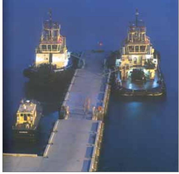
• ميناء الشيخ خليفة