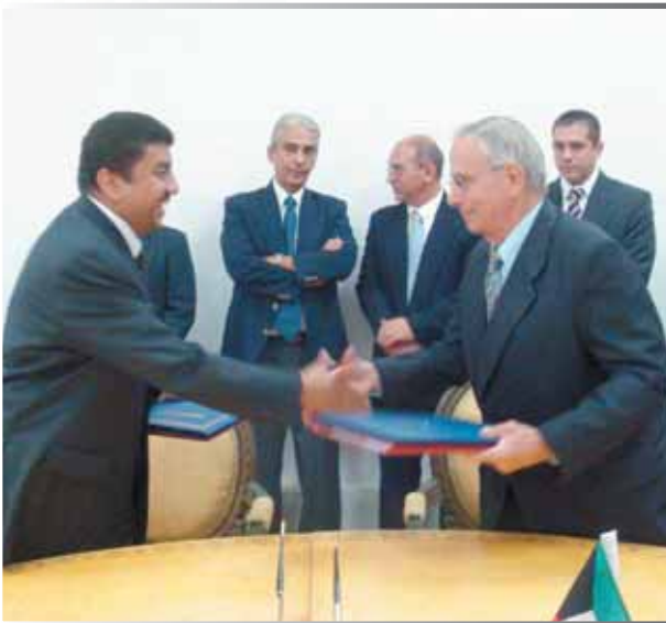
• .. ويتبادلان وثائقها بعد التوقيع

تم في هافانا التوقيع على اتفاقية قرض بين بنك كوبا الخارجي والصندوق الكويتي يقدم الصندوق بمقتضاها قرضاً مقداره أربعة ملايين وأربعمائة ألف دينار كويتي (أي ما يعادل حوالي 14.96 مليون بيسو كوبي)، للإسهام في تمويل تكاليف مشروع إعادة تأهيل نظام مياه الشرب في مدينة هولغين. كما تم التوقيع على إتفاقية ضمان واتفاقية مشروع في هذا الصدد بين الصندوق وممثلي جمهورية كوبا والمعهد الوطني للموارد المائية، على التوالي.