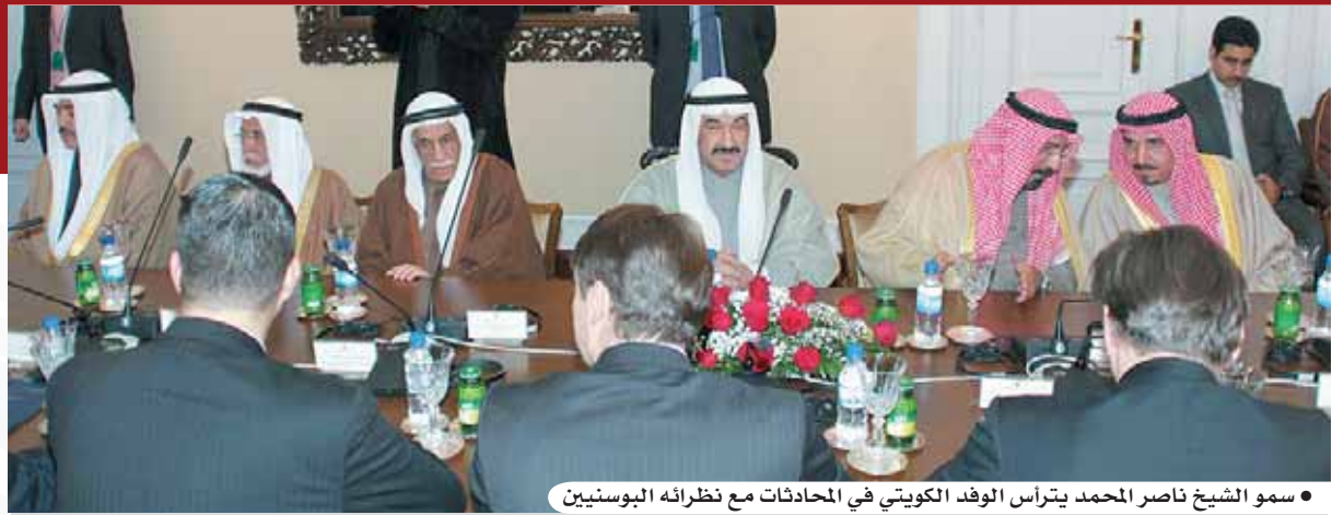
• سمو الشيخ ناصر المحمد يترأس الوفد الكويتي في المحادثات مع نظرائه البوسنيين