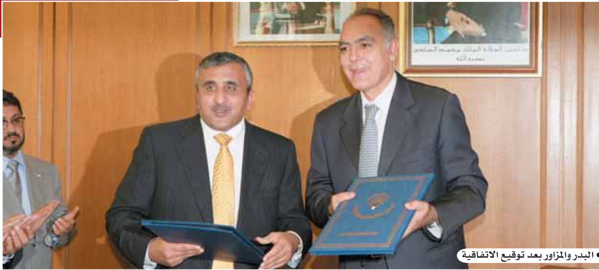
• البدر والمزاور بعد توقيع الاتفاقية