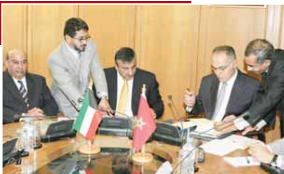
• وزير الاقتصاد المغربي والمدير العام أثناء التوقيع على الاتفاقية

من جهته أكد وزير الاقتصاد المغربي صلاح المزوار أن هناك مشاريع أخرى، ستقدم للصندوق قصد تمويلها، وتهم بناء سد بورزازات، وطريق تربط بين برشيد ويني ملال، والمساهمة في تمويل الشطر الثاني من ميناء طنجة المتوسطي، موضحاً أن هذه المشاريع تروم تحسين تنافسية الاقتصاد المغربي والرفع من معدل النمو وتطوير البنيات التحتية. وقال مدير عام الصندوق الكويتي عبدالوهاب البدر في تصريح لوكالة المغرب العربي للأنباء، أن سد تاملوت يكتسب أهمية بالغة، إذ سيساهم في توفير المياه بإقليم حنيفرة وتعزيز الاقتصاد المحلي، وفي تحسين مستوى عيش سكان المنطقة. موضحاً أن المغرب قام بخطوات هامة على المستوى الاقتصادي مكنت من التخفيف من تأثيرات الأزمة الاقتصادية العالمية على مختلف القطاعات، خاصة في مجال الفلاحة والسياحة.