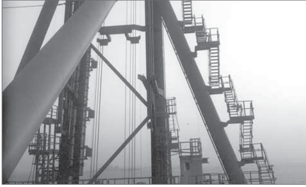
• جانب آخر من الميناء