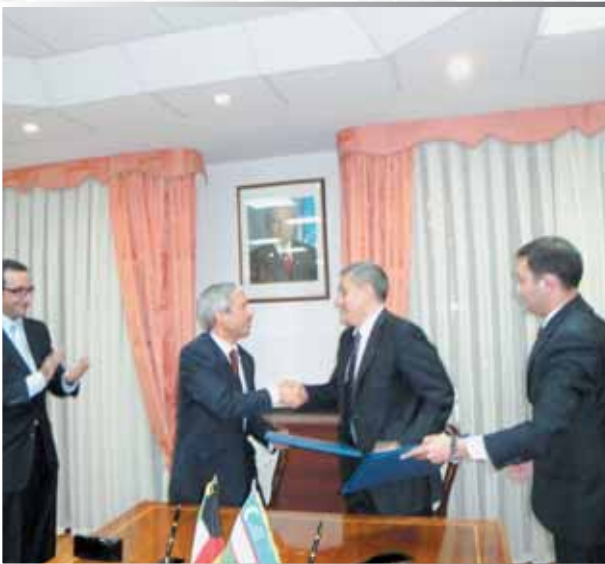
• .. ويتبادلان وثائقها

وقع الصندوق الكويتي وجمهورية أوزبكستان على اتفاقية قرض يقدم الصندوق بمقتضاها قرضاً مقداره 4.34 ملايين دينار كويتي (تعادل حوالي 15.62 مليون دولار أميركي)، للإسهام في تمويل مشروع إعادة تأهيل وتشبيد منظومة الري والصرف في ولايتي سارداريا وجيزاك في جمهورية أوزبكستان.