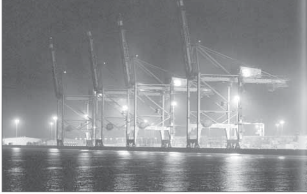
• جانب من الميناء