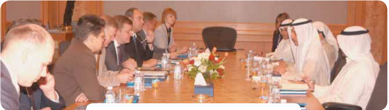
وفد بيلاروسيا خلال مباحثاته مع الصندوق

كما استقبل نائب المدير العام هشام الوقيان وزير الخارجية في جمهورية لاتفيا ماريس ريكستينتر والوفد المرافق له .. بمناسبة زيارته للبلاد، حيث بحث الجانبان التعاون المشترك. حضر اللقاء المدير الإقليمي لدول وسط آسيا وأوروبا وليد البحر. كما استقبل الوقيان وفداً من جمهورية بيلاروسيا برئاسة نائب وزير خارجية جمهورية بيلاروسيا سيرجي ليانك يضم عدداً من المسؤولين في بيلاروسيا .. بمناسبة زيارته للبلاد، حيث بحث الجانبان التعاون المشترك والمشاريع التنموية التي يمولها الصندوق في بيلاروسيا حضر اللقاء المدير الإقليمي لدول وسط آسيا وأوروبا وليد البحر، ومساعد المدير الإقليمي يوسف البدر.