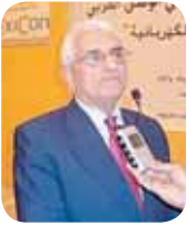
أحمد الكيالي وزير الكهرباء السوري

استقبل المدير العام عبدالوهاب البدر، وزير الكهرباء والطرق في الجمهورية العربية السورية د. أحمد قصي كيالي والوفد المرافق له .. بمناسبة زيارته للبلاد، حيث بحث الجانبان التعاون المشترك والمشاريع التنموية التي يمولها الصندوق في سوريا حضر اللقاء المدير الإقليمي للدول العربية مروان الغانم. جدير بالذكر أن الصندوق قدم للجمهورية العربية السورية (27) قرضاً بلغت قيمتها الإجمالية 318 مليون دينار (ما يعادل مليار وثمانين مليون دولار).