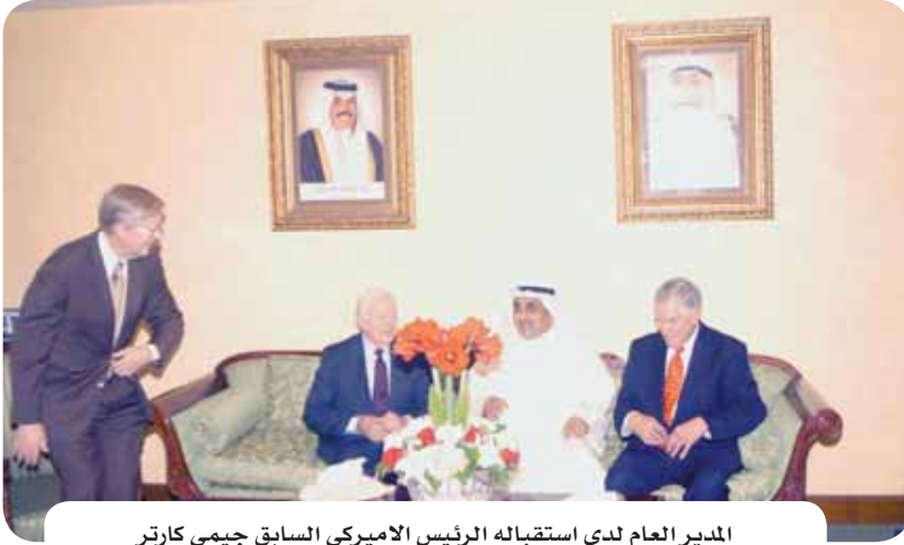
المدير العام لدى استقباله الرئيس الأميركي السابق جيمي كارتر

استقبل مدير عام الصندوق الكويتي عبدالوهاب البدر رئيس الولايات المتحدة الأميركية الأسبق جيمي كارتر والوفد المرافق له بمناسبة زيارته للبلاد. من جهته أشاد الرئيس السابق كارتر بدور الصندوق الكويتي وجهوده في دفع عجلة التنمية ومساعدة الشعوب المحتاجة حول العالم.