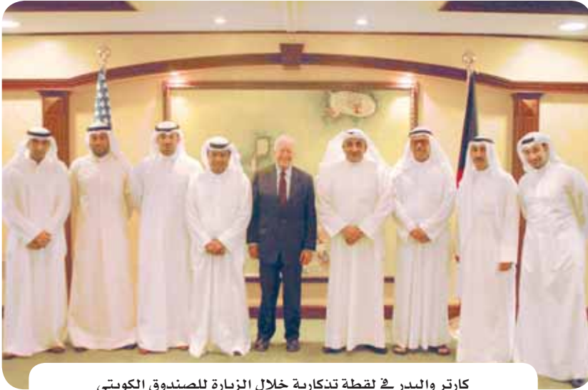
كارتر والبدر في لحظة تذكارية خلال الزيارة للصندوق الكويتي

هذا وقد أقام المدير العام للصندوق الكويتي مأدبة غداء على شرف الرئيس كارتر بمبنى الصندوق الكويتي حضرها عدد من مدراء الأقاليم الاقتصاديين. وجرى خلال مأدبة الغداء تبادل الأحاديث الودية حول عدد من الموضوعات والقضايا المشتركة التي تهم الجانبين.