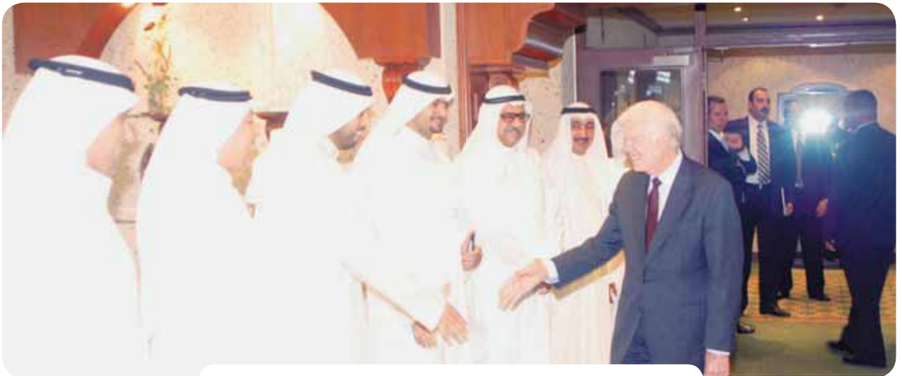
الرئيس الأميركي السابق يصافح مستقبليه في الصندوق الكويتي

جدير بالذكر أن الرئيس الأميركي السابق جيمي كارتر أنشأ هو وزوجته بعد انتهاء فترة رئاسته للولايات المتحدة منظمة تحمل اسم «مركز كارتر» والتي ساهمت في تحسين معيشة شعوب أكثر من 70 دولة حول العالم وتختص بالمساعدات الإنسانية والدفع بالديمقراطية وإحلال السلام، وقد حصل في عام 2002 على جائزة نوبل للسلام تقديراً لجهوده في إحلال السلام حول العالم.