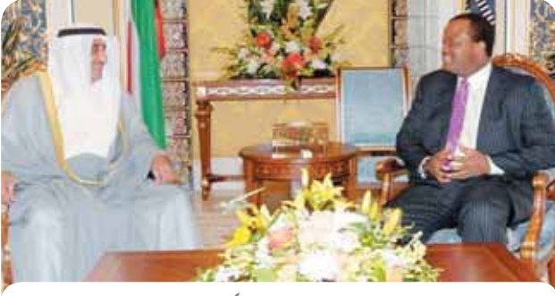
الملك مسواتي مستقبلاً المدير العام